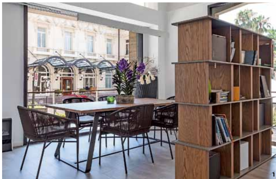
1. Интерьер NG-Studio в Сан-Ремо. Стол и стулья Varaschin. Стеллаж Mobilgam. 2. Квартира в Кап д'Ай на Лазурном Берегу. Стол и стулья Topop, диваны Mussi, тумбы и низкий стол Mobilgam, свет Contardi, ковер Ruckstuhl. 3. Терраса в Монте-Карло. Мебель Braid.