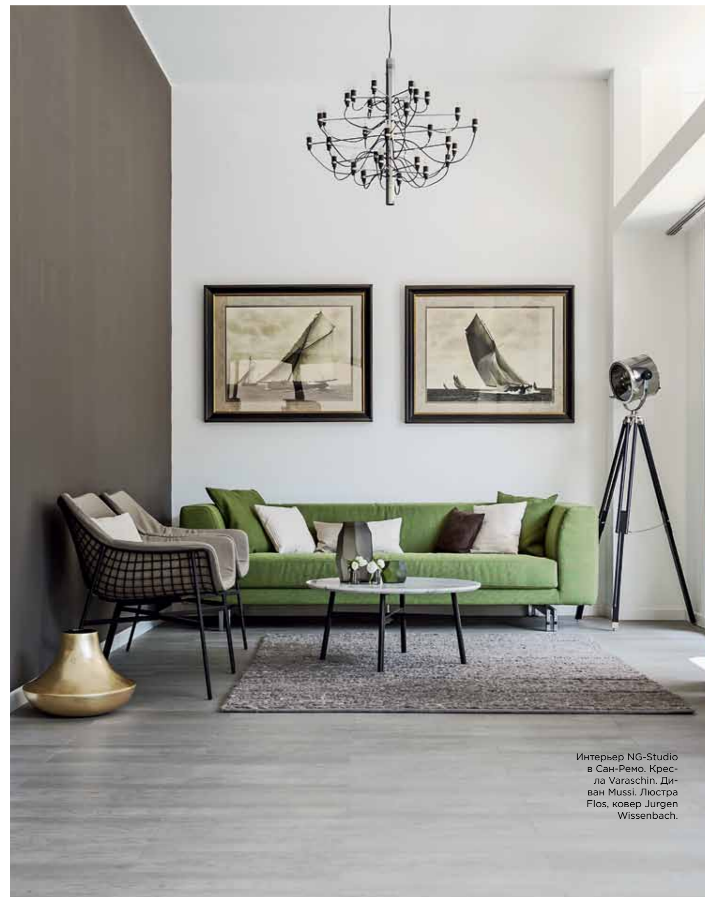
Интерьер NG-Studio в Сан-Ремо. Кресла Varaschin. Диван Mussi. Люстра Flos, ковер Jurgen Wissenbach.