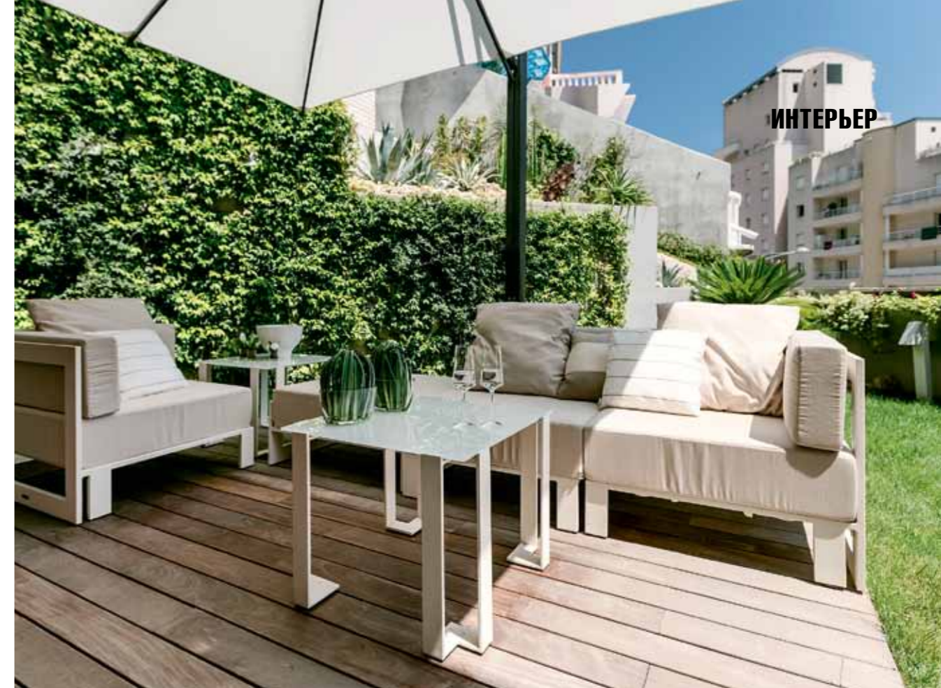
Продолжением гостиной стала открытая терраса, утопающая в зелени